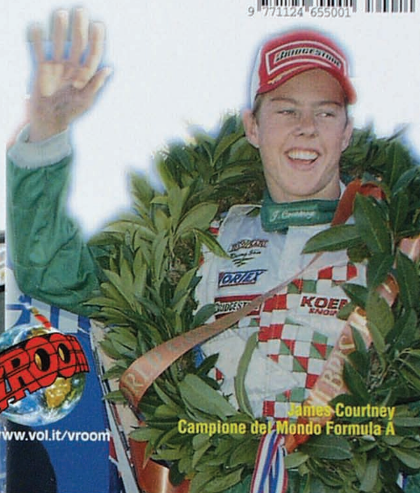
James Courtney Campione del Mondo Formula A

all'interno il maxi poster di Rossi e Manetti