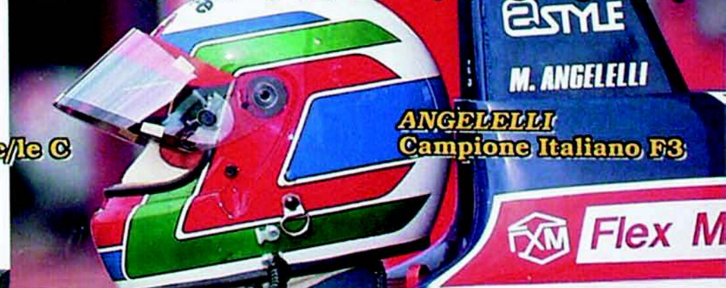
ANGELELLI Campione Italiano F3