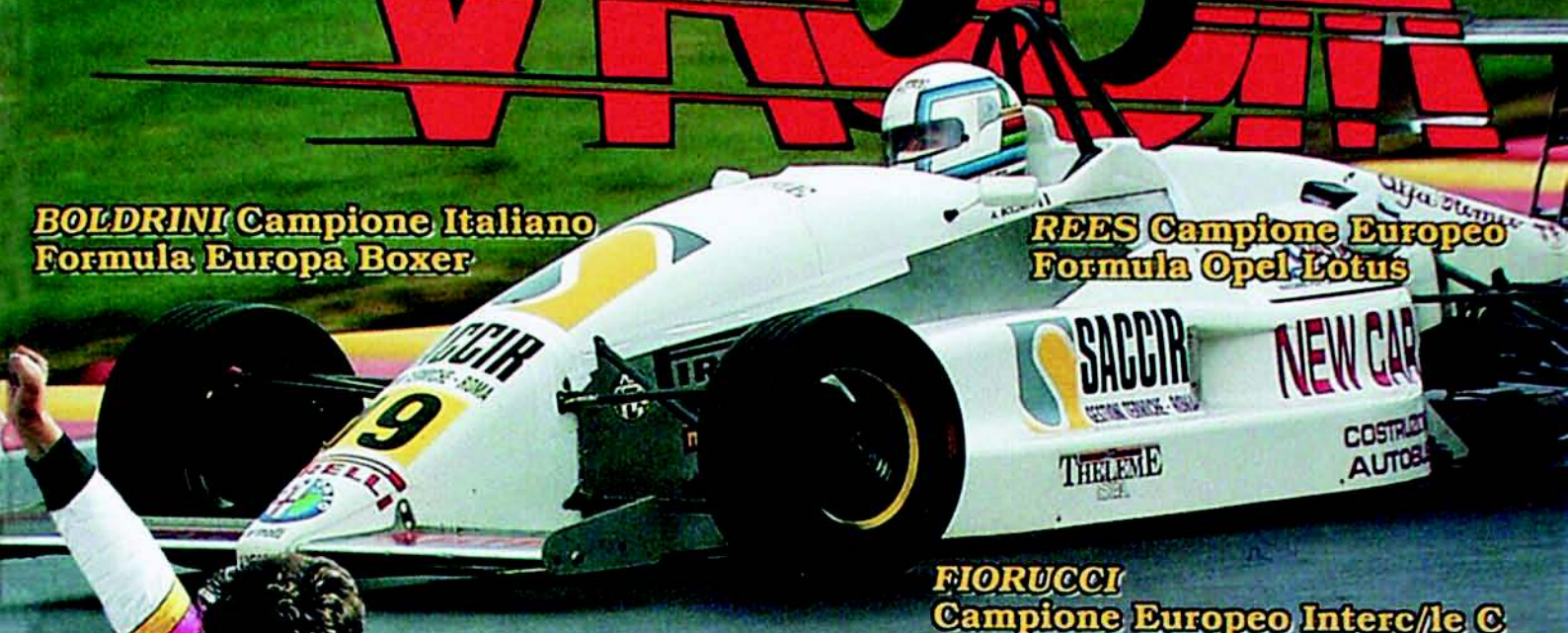
FIORUCCI Campione Europeo Interc/le C