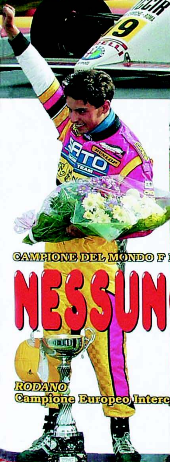
CAMPIONE DEL MONDO F K - CAMPIONE DEL MONDO F C